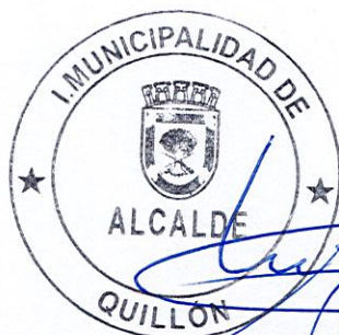
MIGUEL PEÑA JARA ALCALDE MUNICIPALIDAD DE QUILLÓN