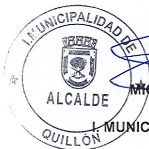
MIGUEL PEÑA JARA ALCALDE I. MUNICIPALIDAD DE QUILLÓN