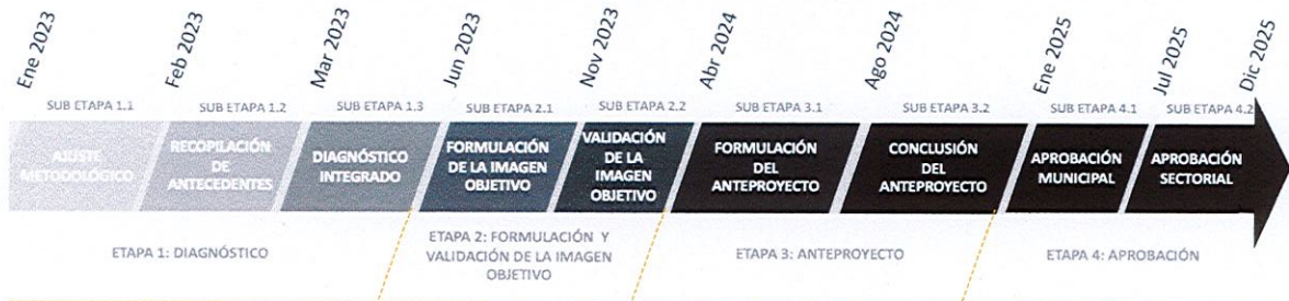
Figura 2: Esquema de Formulación y Aprobación del Plan

13. Que el plazo estimado para la elaboración y aprobación de la modificación del Plan Regulador Comunal de Quillón es de 3 años. Este plazo es aproximado y corresponde al contemplado por el estudio que proporcionará los antecedentes técnicos para la confección del Proyecto de Planificación y su posterior asesoría durante la fase de aprobación. Se distribuye en 4 etapas de trabajo, de acuerdo a la descripción en la siguiente figura: